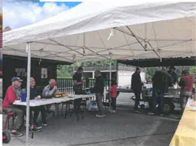
15/16 Juin : fête du village