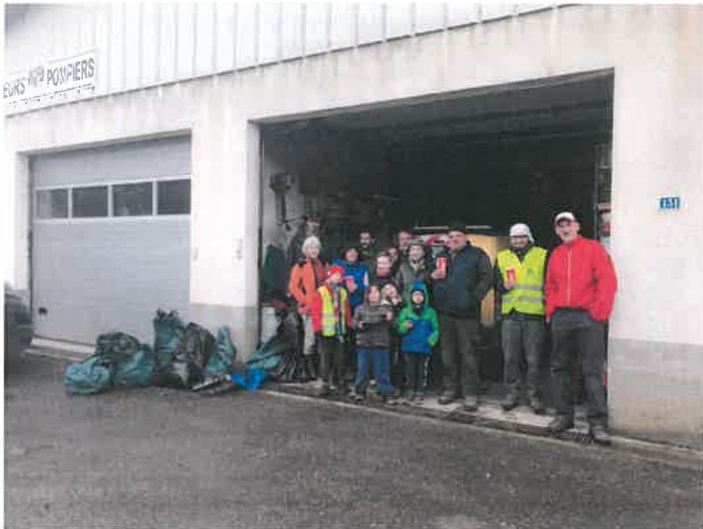
23 Mars : opération "Village propre"