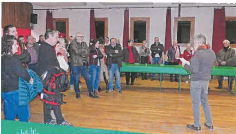
6 Janvier : les voeux du conseil municipal