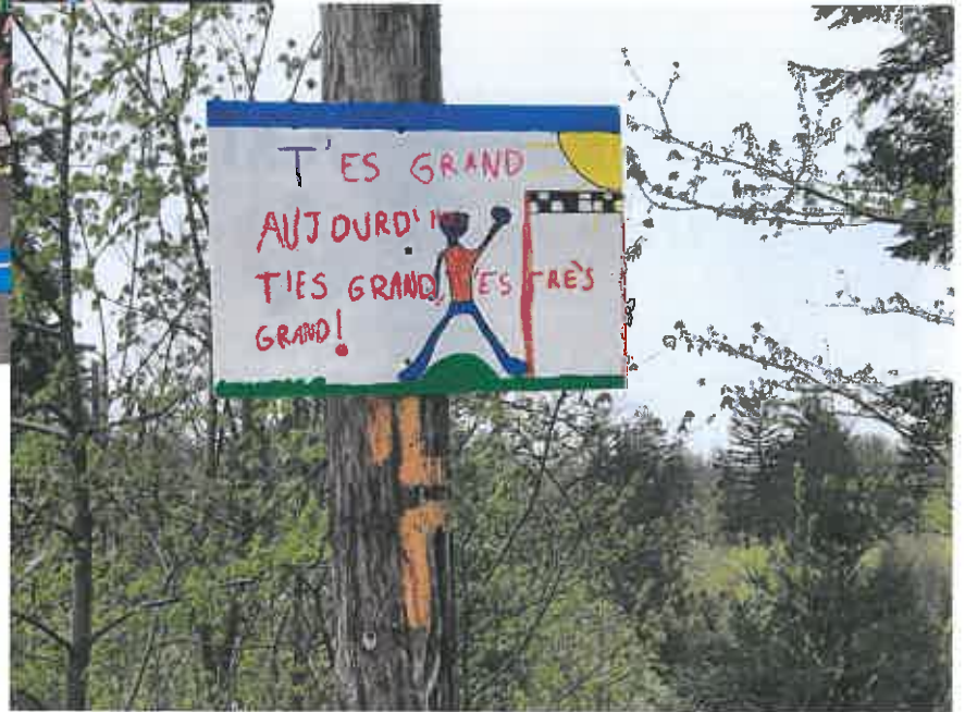
21 avril : Trail de l'école