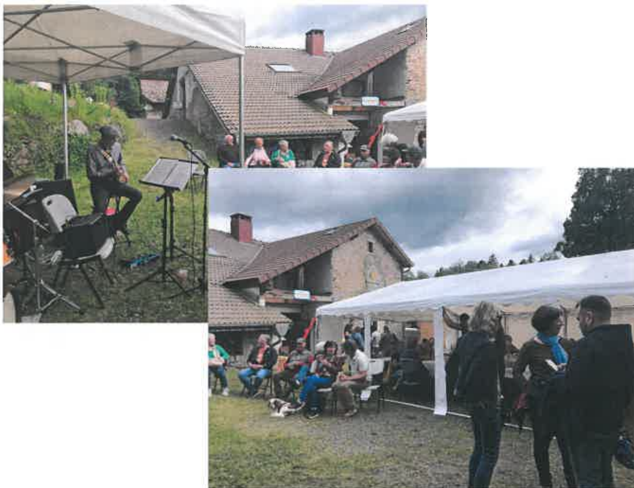
22/23 Juin : Concert de jazz aux Portes Ouvertes du Rucher École