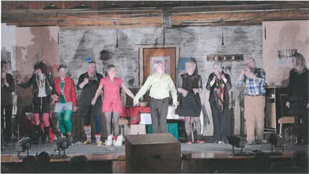
Mars/Avril : les représentations de la troupe "les Fresse en l'air"