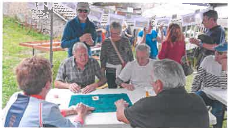
Tournoi de cartes des Genêt