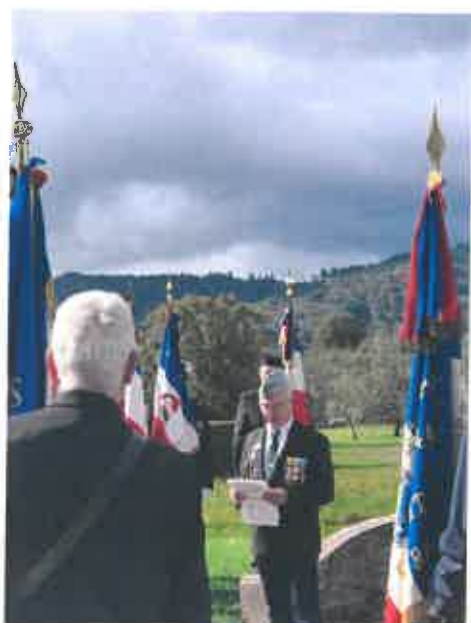
80ème anniversaire de la Libération de Fresse