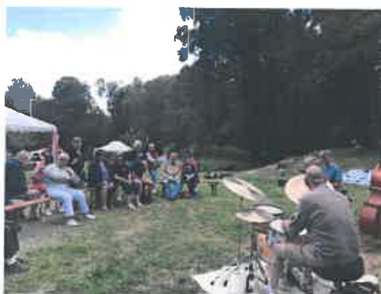
Concert de jazz en plein air