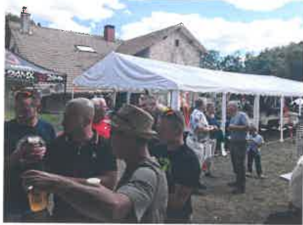
La buvette de Fressanim

Alors à quand la 3ème version de cette journée ? On vous en dira plus dans la prochaine édition de votre Fressmag !!