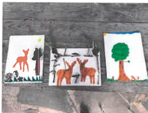
Les 3 plus beaux dessins du concours des chasseurs

Cette sympathique journée juste avant la rentrée permet de :