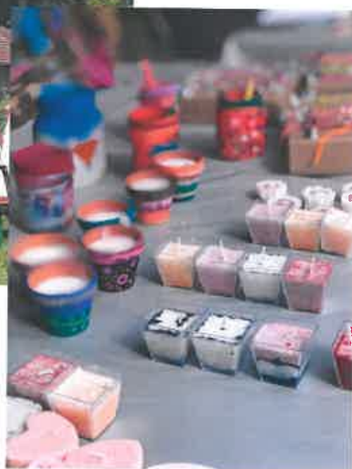
La journée des associations