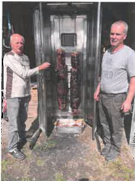
Les sangliers rôtis des chasseurs

Après le succès de la première édition, une nouvelle journée des associations a eu lieu le dimanche 25 août 2024, autour de la maison communale de la Loyère au Rondey.