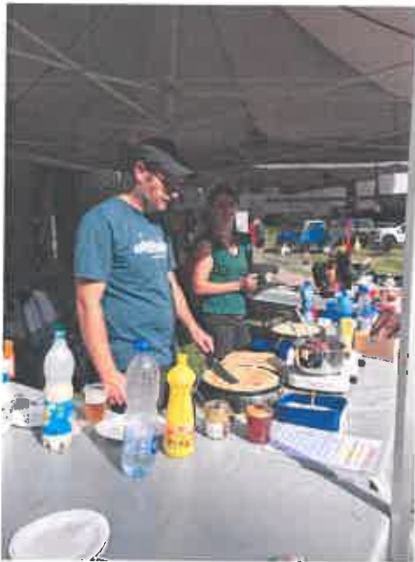
Le stand des parents d'élèves l'Abeille