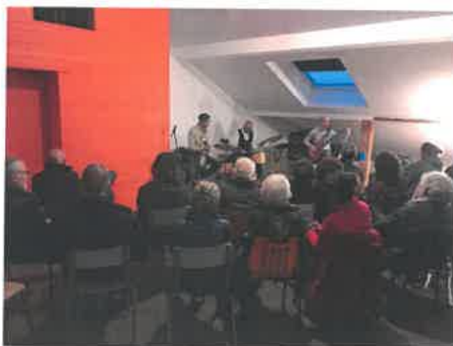
Concert de Jazz